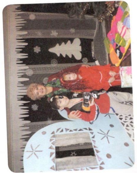
Знакомство Дмитриевны с Алейкой на празднике