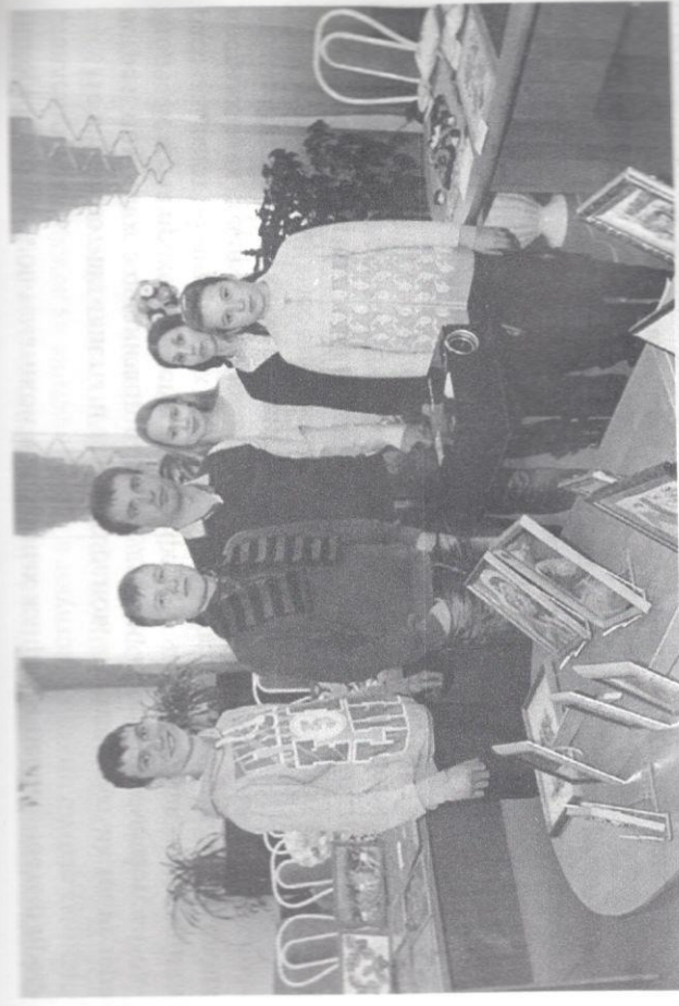
Девиз социальных гидов: «Успешен сам — помоги стать успешным другому»

Далеко не всегда слова взрослого и педагога воспринимаются ребенком, при позиции «равный — равному» можно донести те моменты, которые не были услышаны. Социальные гиды оказывают помощь в работе службы «Перекресток», администрации и специалистов центра, пропагандируя и транслируя свой успешный опыт жизненного становления.